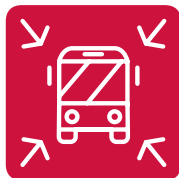
Gute Verkehrs- anbindung