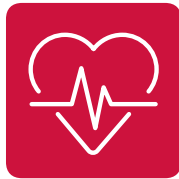
Betriebliches Gesundheits- management