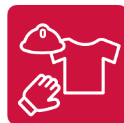
Stellung von Arbeitskleidung