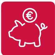
Vermögenswirk- same Leistungen