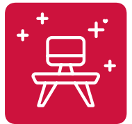
Moderne Büroaus- stattung