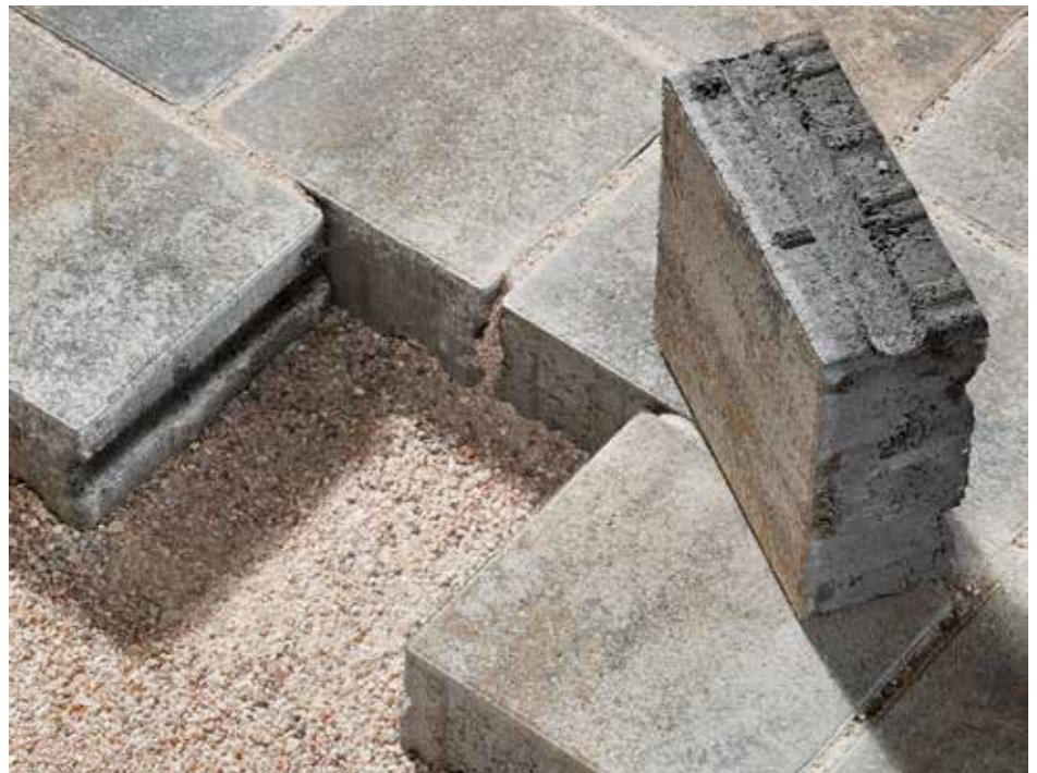
DRAINSTON protect – Das Wasser versickert über die Fugen und die horizontalen und vertikalen Kanäle am Stein.

Bereits im vergangenen Jahr stellte die KANN GmbH Baustoffwerke in Bendorf ihre Reihe La Tierra-Aqua vor. Sie vereint ökologische und optische Aspekte miteinander und wird vorzugsweise auf größeren Flächen, wie beispielsweise Garagenauffahrten oder Eingangsbereichen sowie Vorplätzen eingesetzt. Durch den Einbau dieses Ökopflasters sinkt der Anteil der versiegelten Grundstücksfläche und damit auch die Höhe der Gebühren für das Oberflächenwasser. In der verlegten Fläche wirkt La Tierra-Aqua optisch wie das klassische La Tierra-Pflaster. Der Unterschied besteht in der 5 mm breiten Sickerfuge, die das Niederschlagswasser sicher in den Untergrund ableitet. Seitliche Abstand-